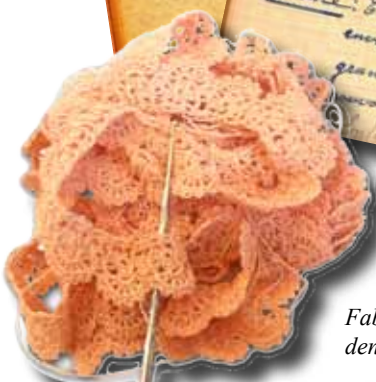
Fabrication au crochet de dentelle avec du coton fin.

La couche culotte Choixse à prendre : 1 re toile carré de 65 cm pour deux couches 2 e toile carré de 70 cm pour deux couches 3 e toile carré de 85 cm pour deux couches Traces du patron : Tracer un carré ayant 65 cm de côté base 8 diagonales pointillées. Abaisser du devant Sur la plieuse en partant de la toile descendre le quart de la longueur de la couche obtenir une horizontale parallèle à la toile. En point de l'intersection de l'oblique et de cette nouvelle ligne tracer une verticale pour la milieu du devant. Contour de la jambe : Diviser l'oblique restante en 4. Tracer une point de plus près du milieu du devant. Tracer une horizontale et au 5 e point une verticale, fa- isant un angle droit avec la première ligne. Tracer une oblique bissectrice de cet angle au point du mi- lieu de l'oblique et la diviser en deux. La couche se tisse du 1 er au 5 e point en passant par le milieu de la bissectrice (comme un peu les 2 droites) environ. La longueur est généralement un peu plus grande que le contour de taille de l'enfant afin de pouvoir glisser une couche pour pouvoir serrer à