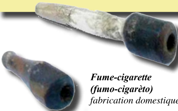
Fume-cigarette (fumo-cigarèto) fabrication domestique