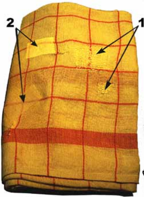
Torchon (Patailhoun) Torchon reprisé (1) puis rapiécé (2) par 2 générations d'utilisateurs.