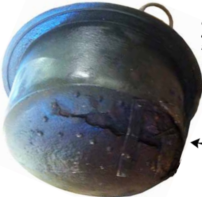
Chaudron (pèïroou) Chaudron réparé avec des plaques métalliques rivetées.