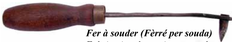
Fer à souder (Fèrré per souda) Fabrication domestique avec du fil de fer et une balle de fusil de guerre (MAS 36).