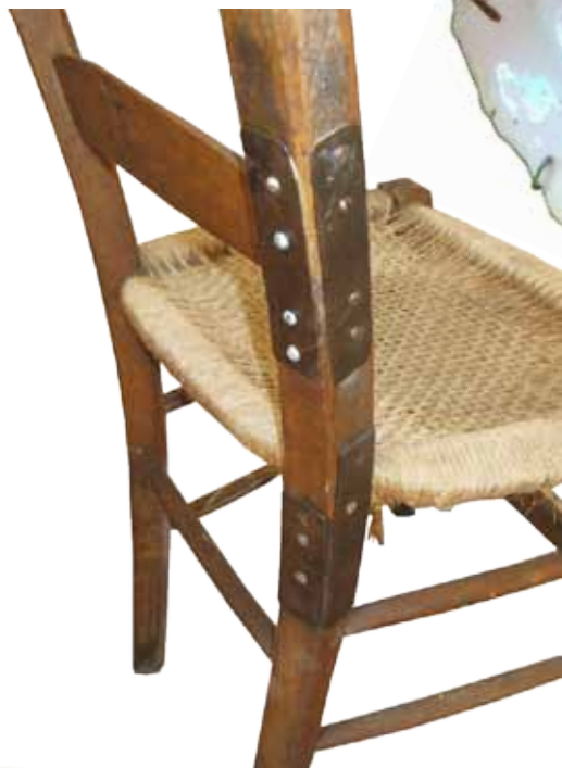
Chaise (cadiero) L'assise a été refaite avec de la fi- celle et les jambes renforcées avec des plaques de métal.