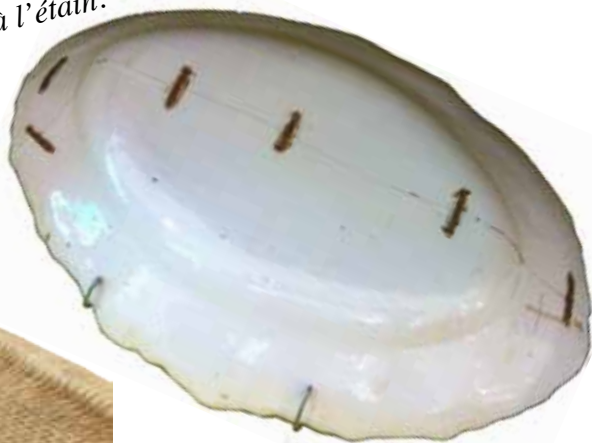
Plat (plat) Plat en faïence vu de dos réparé avec des agrafes métalliques.