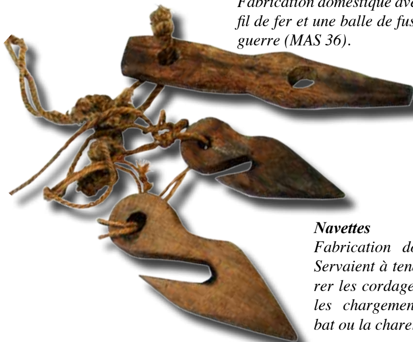
Navettes (Tacoulo) Fabrication domestique. Servaient à tendre et ser- rer les cordages retenant les chargements sur le bat ou la charette.

«L'économie est la vertu qui porte à régler sagement la dépense» dit le dictionnaire